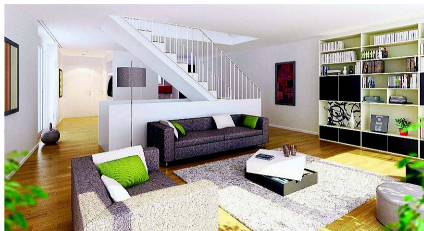
Für die zwölf Doppel-einfamilienhäuser liegt die Baubewilligung vor.