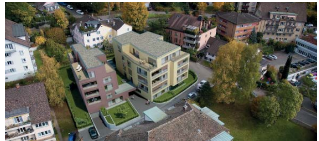
Visualisierung: Die Mehrfamilienhäuser „im Schilf 2+4“ aus der Vogelperspektive Bauherrschaft: Mobimo AG, Luzern

> Ja, anfänglich schon. Einerseits trafen LKW's auf Grund des Stadtverkehrs mit Verzögerungen auf der Baustelle ein. Andererseits gab es einen Parkplatzmangel, da in nächster Umgebung keine Parkmöglichkeiten vorhanden waren. Durch den Kontakt zur Stadtpolizei konnte das Problem gelöst werden.