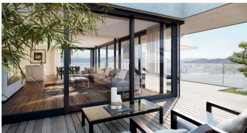
Visualisierung: Attikawohnung mit Patio und Blick auf den Vierwaldstättersee