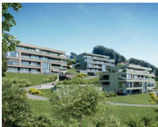
Visualisierung: Aussenansicht der Häuser Rebstockhöhe

> Mit der Vermarktung haben wir Anfang September gestartet. Das Interesse an den einzigartigen Panoramawohnungen ist sehr gross. Wir planen mit den Bauarbeiten im Februar 2014 zu starten und die zwölf fertig gestellten Panoramawohnungen Ende 2015 ihren Eigentümerinnen und Eigentümern zu übergeben.