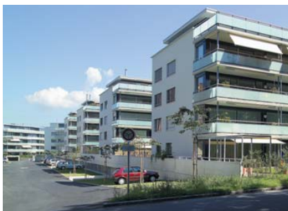
Die bereits in den Jahren 2003 bis 2005 realisierte Wohn- und Geschäftsüberbauung mit Dorfcharakter