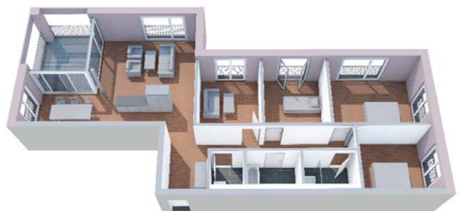
Visualisierung Wohnungsgrundriss Überbauung Burghalde 52 in Lenzburg erstellt von Marc Boom

Ja, ab dem 3. Lehrjahr durfte ich in den Projekten als Zeichner mitarbeiten. Ein Umbauprojekt wie in Brugg hat zum Beispiel speziellere Anforderungen und Rahmenbedingungen. Diese Erfahrung konnte ich wiederum im 4. Lehrjahr beim Neubauprojekt in Lenzburg umsetzen, in dem ich verantwortungsvolle Aufgaben in der Planung der beiden Mehrfamilienhäuser übernehmen konnte. Zudem durfte ich für dieses Projekt auch Visualisierungen erstellen, welche auf der Bautafel ausgestellt wurden. Ein anderes Projekt konnte ich komplett alleine in 3D aufbauen.